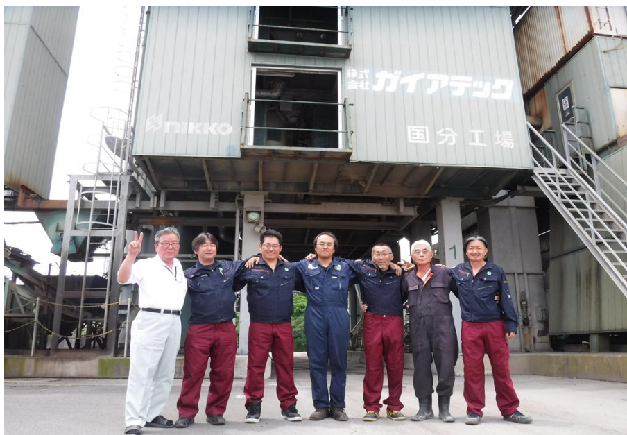
国分工場メンバー

最後に、これからも顧客の求める品質及びサービスの提供を行いながら、工場の維持と発展のため、地域との共存に工場全員で努めていきます。