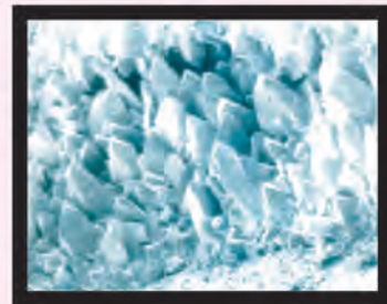
カルサイト結晶体 (方解石)